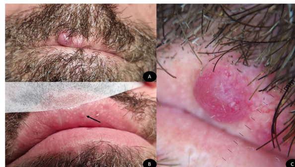
Figura 1 Nódulo eritematoso de superficie lisa localizado en labio superior de aspecto angioide (A), pápula eritematosa en mucosa interna de labio superior (flecha negra) (B). Patrón homogéneo eritematoso con áreas blanquecinas y vasos tortuosos dilatados (Dermlite® DL4, Dermlite LLC, EE. UU.) (C).

No se realizaron pruebas complementarias para el diagnóstico del paciente.