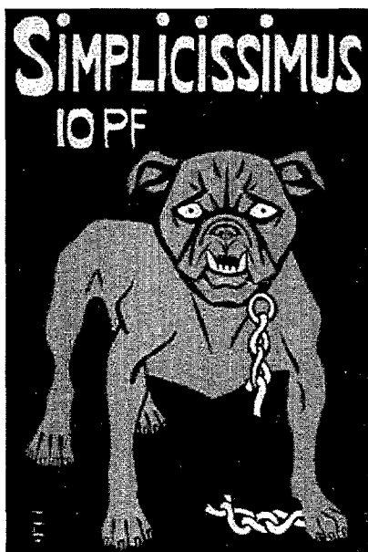
El bulldog de Simplicissimus .