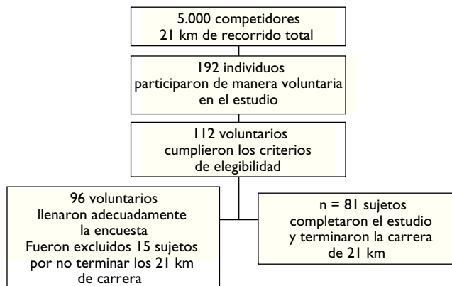
Figura 1 Diseño del estudio.

PAF), y el cálculo metabólico indirecto, mediante la fórmula del ACSM 14,15 y su relación con el tiempo registrado al final de la competencia, algunos indicadores antropométricos y socio-demográficos, en un grupo de voluntarios participantes de la 7.ª Media Maratón de Santiago de Cali en 2008.