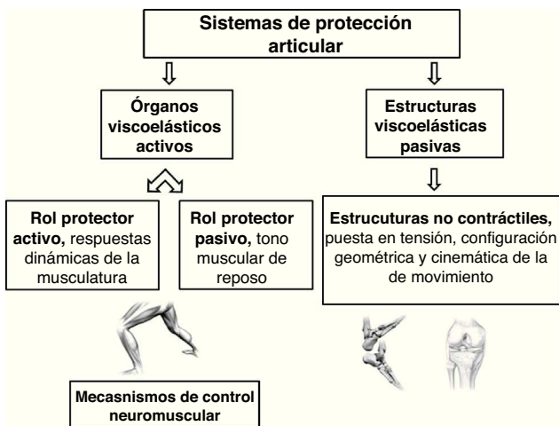
Figura 3 Sistemas de protección articular.

Otra definición es la de Roberts (2003), que sigue la utilizada por B.D. Wyke 9 : conciencia de la posición articular (sensación de posición) y conciencia del movimiento en el espacio (kinestesia); y feedback de los mecanorreceptores que ejercen un efecto continuo reflejo e inconsciente sobre el tono muscular y el equilibrio, mediante el circuito de