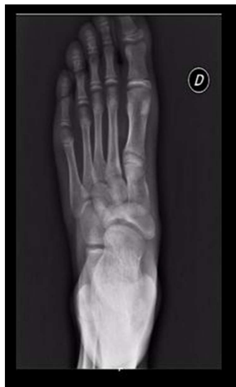
Figura 1 Radiografía anteroposterior: alteración en la morfología del escafoides tarsiano en forma de «coma». Primer metatarsiano corto.

Consultó en el servicio médico por dolor en el pie izquierdo acompañado de impotencia funcional en el contexto de una contusión durante un partido. A la exploración