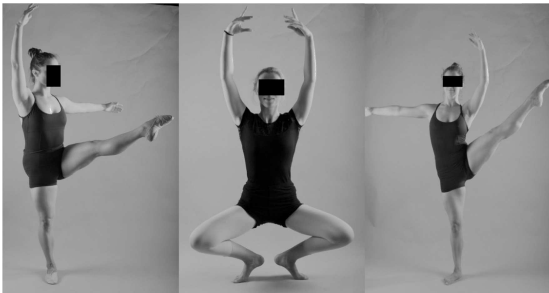
Figura 3 De izquierda a derecha: Développé devant , Grand plié , Développé à la seconde .

• Hopper et al. 13 investigaron los factores de riesgo de lesiones potenciales relacionados con las propiedades mecánicas de los suelos usados por el bailarín.