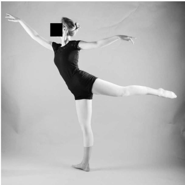
Figura 2 Arabesques. Fuente: elaboración propia.

3; sin embargo, la base de datos Cinahl no mostró ningún resultado válido.