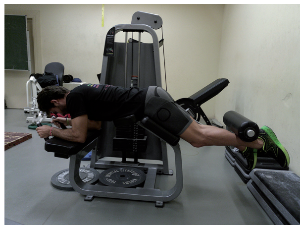
Figura 2 Curl femoral excéntrico (posición final).