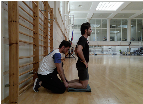
Figura 3 Nórdico para isquiosurales (posición inicial).

Esta activación en cada uno de los ejercicios puede verse variada en función de la posición de los pies. Así, con una rotación externa activa de los pies los isquiosurales laterales (bíceps femoral) se ven más activados, mientras que una rotación interna de los pies produce una mayor activación de los isquiosurales mediales (semitendinoso y semimembranoso) 53 .