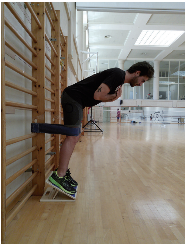
Figura 6 Cinturón ruso (posición final).