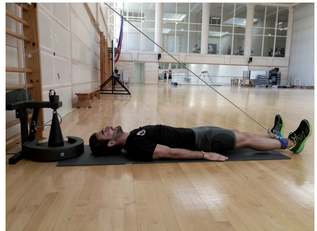
Figura 7 Catapulta para isquiosurales (polea cónica) (posición inicial).