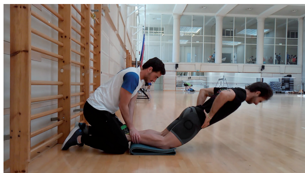
Figura 4 Nórdico para isquiosurales (posición final).

El principal momento en que se producen distensiones isquiosurales es en la carrera, en el momento previo a apoyar el pie en el suelo y en el chut 10,15 .