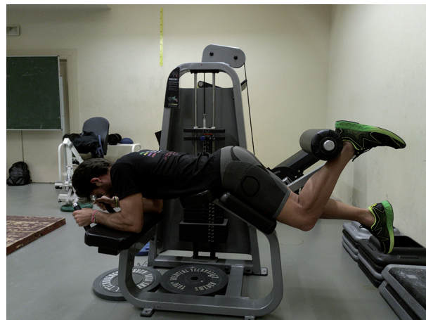
Figura 1 Curl femoral excéntrico (posición inicial).

Las lesiones en los isquiosurales pueden producirse tanto al final de la fase de vuelo como al inicio de la fase de oscilación en el suelo 23,45-47 durante la carrera, lo que hace rele-