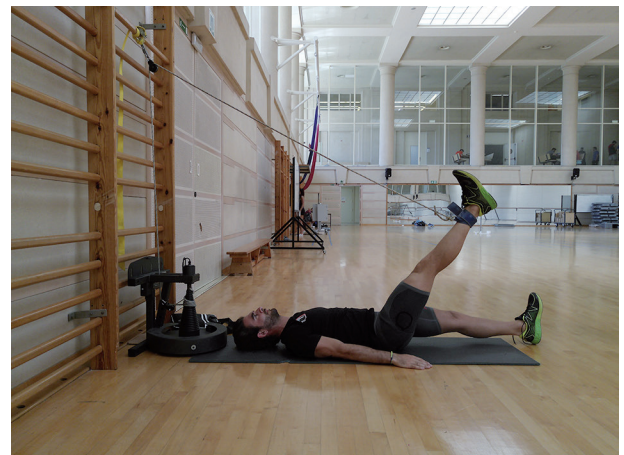
Figura 8 Catapulta para isquiosurales (polea cónica) (posición final).

Su protocolización se define atendiendo a los siguientes parámetros comunes, que deben adaptarse individualmente a cada deportista y atendiendo a los factores de riesgos específicos definidos anteriormente. La programación de ejercicios consta de dos rutinas semanales. La rutina 1 se trabaja en el gimnasio con el curl femoral y la catapulta para isquiosurales, mientras que la rutina 2 se desarrolla en el campo con el nórdico para isquiosurales y el cinturón ruso. La carga de trabajo consta de 2 series de 6 repeticiones ( 2 \times 6 ) por ejercicio 57,58 . En periodos de carga (pretemporada) se realizan las dos rutinas, mientras que en periodos competitivos (temporada) se realizará solo la rutina 2, con la intención de evitar la aplicación ejercicios de fuerza excéntrica de alta intensidad o duración en periodos competitivos, atendiendo a que sus afectos secundarios de dolor muscular y déficit de fuerza podrían reducir el rendimiento 44 . Estas rutinas deberían ser incluidas en un protocolo de carácter multifactorial 57 y completadas con ejercicios de estabilidad del core y ADM.