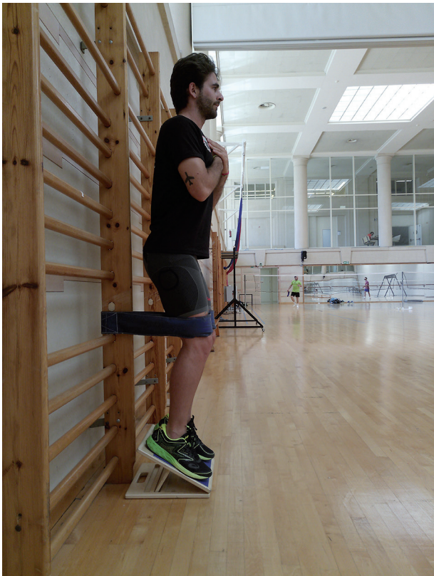
Figura 5 Cinturón ruso (posición inicial).