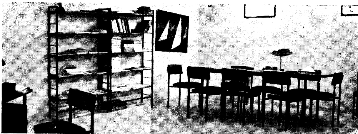
Despacho - Biblioteca del Centro.

entendido de que su función no es la de practicar revisiones de aptitud para el deporte —función de otra parte cubierta a plena satisfacción por otros Centros—, sino de investigación y control de entrenamiento de deportistas destacados en las diferentes disciplinas.