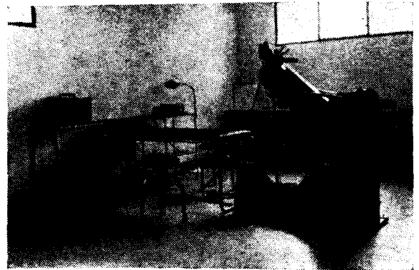
Sala de exploración funcional.

Ubicado como decíamos en principio en terrenos de la Residencia Deportiva «Joaquín Blume» y anexo al gimnasio y piscina cubiertos de la misma, el nuevo Centro Médico cuenta con una sala de exploración funcional, servicio de radiología, gabinete psicotécnico, biblioteca-despacho, sala de conferencias, vestuario y servicios propios. En su planificación ha presidido el más moderno funcionalismo, permitiendo que con poco espacio se aseguren las mayores exigencias. El Centro ha sido provisto de utillaje de exploración clínica que en princi-