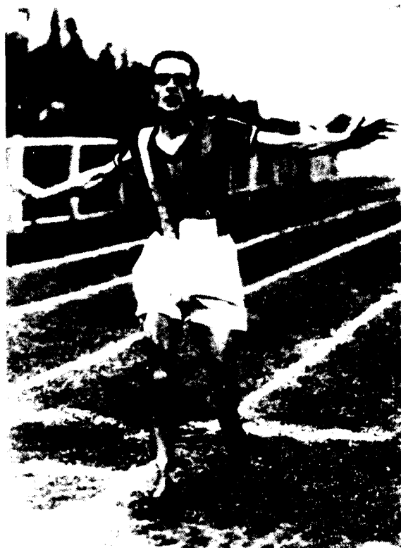
UGO FRIGERIO, el campeón melómano.

FOSTER POWELL fue un pasante de notario que en 1764, a los 30 años de edad, cubrió 50 millas (81 kms.) en 7 horas. En seguida POWELL se presenta en Suiza y Francia, no reapareciendo en Inglaterra hasta 1773, para recorrer la distancia York - Londres, ida y vuelta (402 millas - 650 kms.) en cinco días y 18 horas, tiempo que 18 años después rebajará sensiblemente. Idolo de Londres, se exhibe en el anfiteatro de Astley en una pista circular, de pequeño diámetro, durante doce días, lanzando desafíos a los espectadores; al treceavo día cae enfermo y muere poco después.