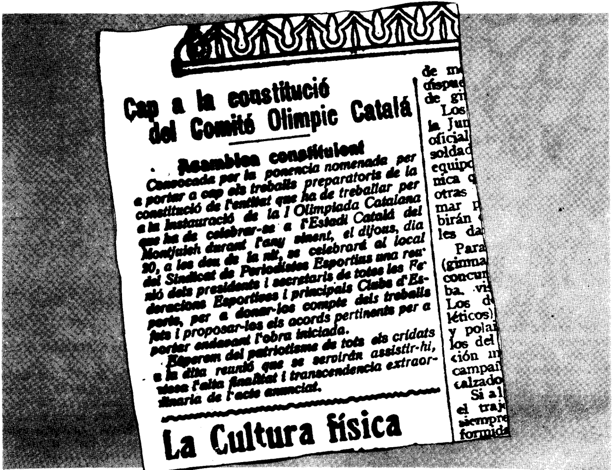
Fig. 2. Convocatòria de l'assemblea constituent del Consell de les Olimpíades. ("Correo Catalán" 18 de gener de

d'instaurar la I Olimpíada Catalana i preparar la VIII Olimpíada de 1924.