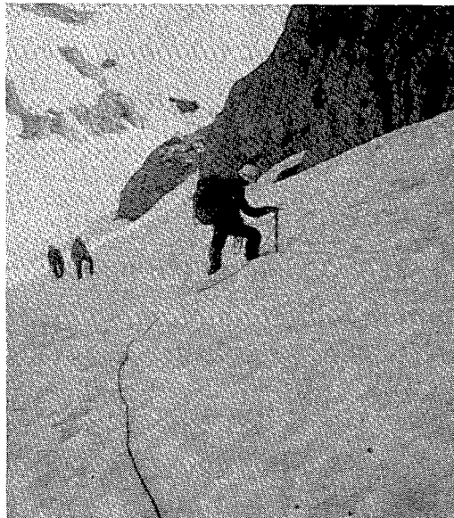
Ascensión al FEIXANT (2.955 m) por su cara norte. Abajo los lagos de MULIERES. Macizo Central Pirenaico