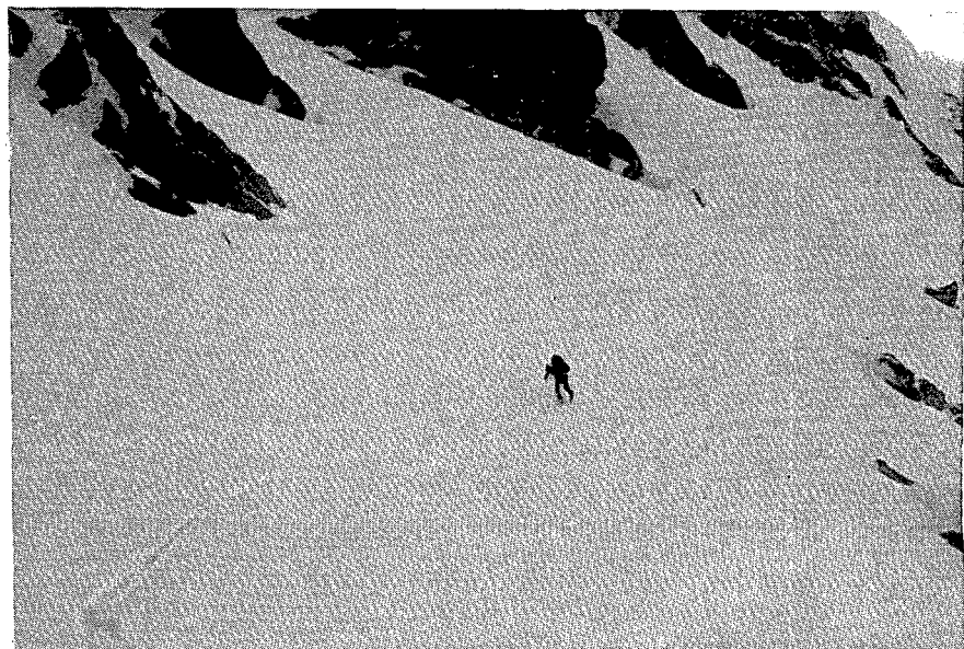
Ascensión con esquís a la Punta Alta (3.034 m) por su vertiente norte. Macizo Central Pirenaico