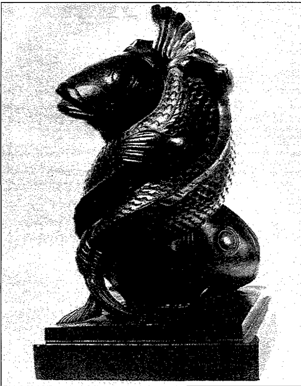
Fig. 4. Lluita. Bronze, petit format.