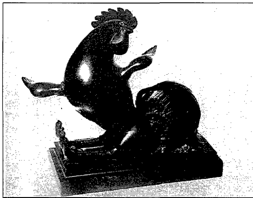
Fig. 3. Gimnàstica. Bronze, petit format. Fig. 3. Gimnasia. Bronce, pequeño formato.

Recordarem també que l'any 1988 la sala d'art Artur Ramon presentà una exposició d'escultures i dibuixos sota el nom El Bestiari de Josep Granyer. D'entre les 10 extraordinàries escultures en bronze hi havien 3 de temàtica esportiva. Una gallina d'ales desplegadas que correspon al títol de Gimnasta , dos peixos lluitant enllaçats ( Lluita ) i un cavall dret sobre dues potes mentre aguanta la sella amb les