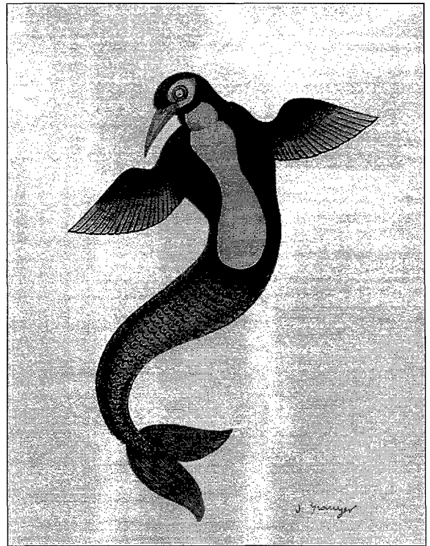
Fig. 2. Bestiari: ésser híbrid. Acuarela. Fig. 2. Bestiari: ser híbrido. Acuarela.

altres dues, personificant la noble actitud d'un jenet ( Jockey ). L'obra que ha inspirat aquest article, dedicada a un esport de risc, a la qual no li falta qualitat artística, sobrepassa de bon tros el concepte d'ironia agredolça per caure dins l'humor negre. El lector jutjarà per si mateix.