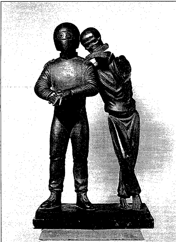
Fig. 6. Esport de risc. Bronze, format mitjà.