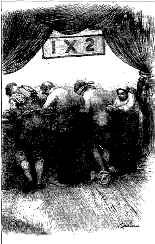
Figura 2. "Travesses". Dibuix sobre cartró. Figura 2. "Quinielas". Dibujo sobre cartón.

ra de llibres de somni i d'aventura –Els viatges de Gullivert de Jonathan Swift i Les aventures de Robison Crusoe de Daniel Defoe, entre d'altres–, per petites coses i objectes banals com una baldufa gegant, els cromos de les preses de xocolata, la sopera casolana de l'escudella diària o per la inusual contemplació d'un concurs de globus aerostàtics. Totes aquestes vivències junt a aspectes urbanístics del seu barri, com les xemeneies de les fàbriques, l'espectacular torre de les aigües o els gasòmetres, es reflecteixen de manera continuada en tota la seva extensa obra artística.