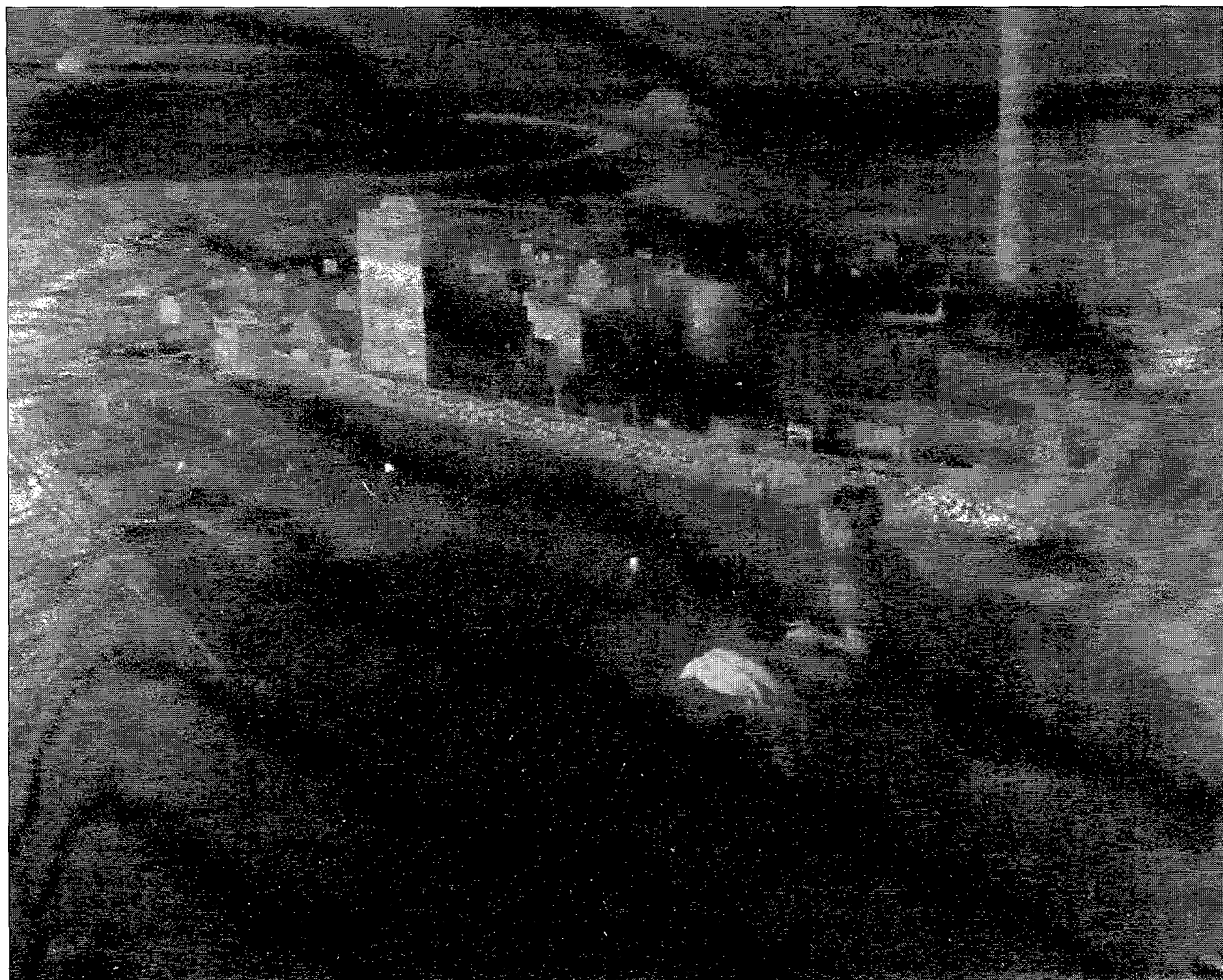
Figura 5. "Composició". Oli sobre tela (1965). Figura 5. "Composición". Óleo sobre tela (1965).

uns és poètica i tendra, per a altres és difícil de classificar, perquè ni es surrealista, malgrat ser intensament imaginativa, ni es humorística, encara que en moltes ocasions es irònica i sarcàstica.