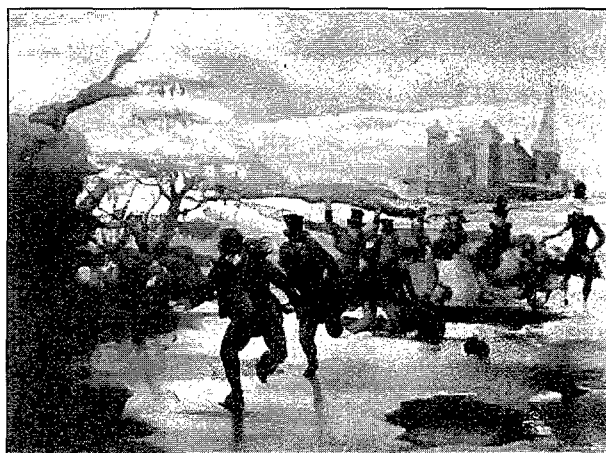
Figura 4. "Patinatge sobre gel". Oli sobre tela (1935).

Al llarg de la seva perllongada vida artística, Calsina conreà el dibuix sobre paper o sobre cartró, el cartellisme, l'il·lustració de llibres (el Quixot, les obres d'Alan Poe, el Pickwick de Dickens, etc.) i la pintura a l'oli. En aquesta última vessant si poden trobar extraordinaris retrats, natures mortes, flors, i una inacabable quantitat d'obres sobre temàtiques variades i inversemblants, en les quals no falten els records d'infantesa amb imatges de globus, sopeses o xemeneies com a contrapunt. L'obra de Calsina ha estat poc compresa, ja que mentre que per a