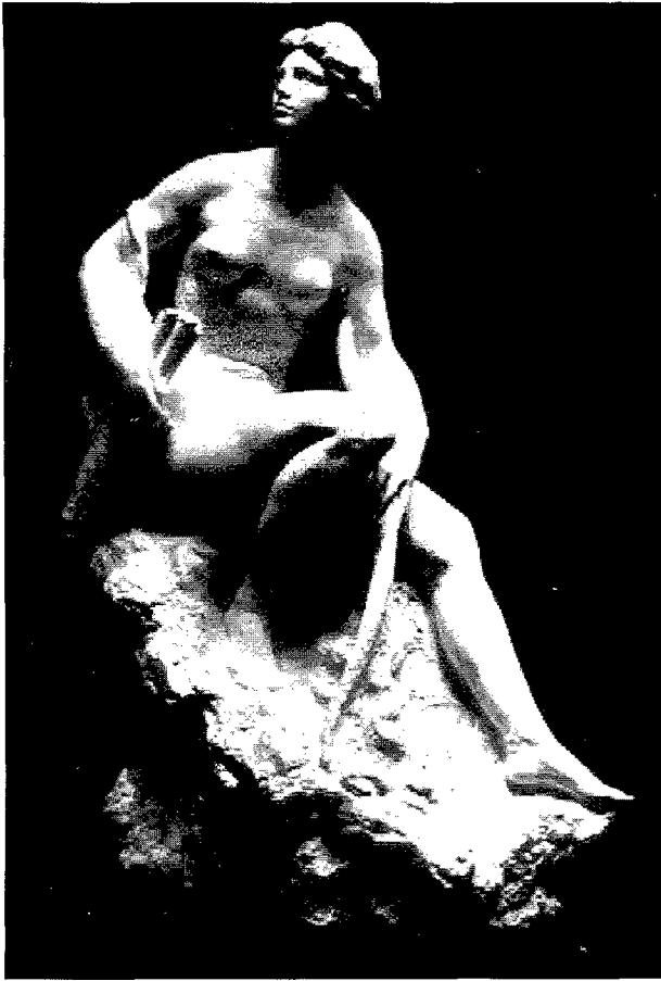
Figura 7. Diana, guix (1972). Figura 7. Diana, yeso (1972).

i l'altre manejant amb desembaràs l'arc. En ambdues se'ns mostra una Diana adolescent, de suaus línies corporals i formós rostre, tot més propi d'una esportista que d'una agressiva deessa caçadora.