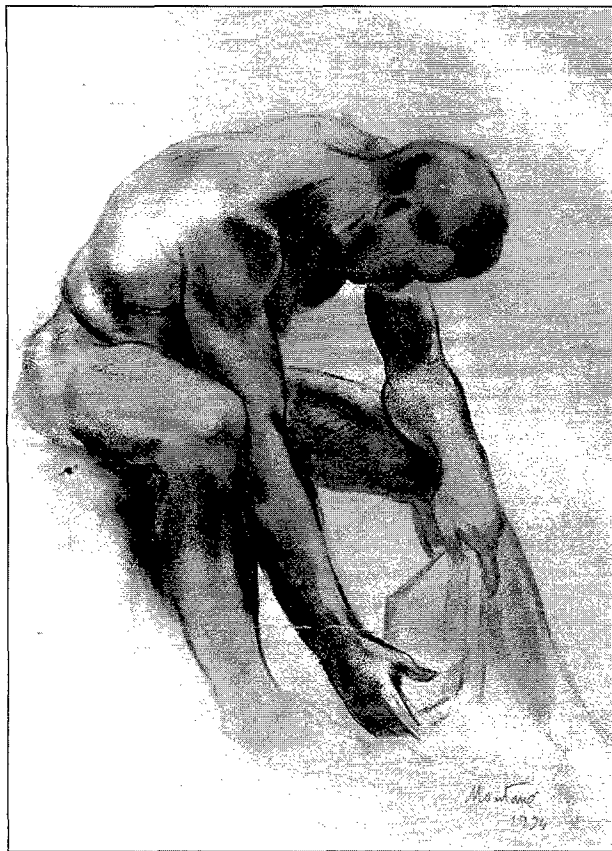
Figura 3. Dibuix carbó (1934). Figura 3. Dibujo carbón (1934).

Lluís Montané, nascut a Sant Celoni el 1905, és un artista integral, enmarcat dins les corrents noucentistes i mediterrànistes que es sustenten en la tradició clàssica del món grec. Durant la seva prolongada vida artística, doncs als vuitanta anys segueix en plena activitat creadora, ha conreat la pintura i l'escultura. Escultòricament en la seva extensa obra, que pot admirar-se en diferents museus i llocs públics, es troben temes mitològics i religiosos, nusos femenins i escenes de dansa.