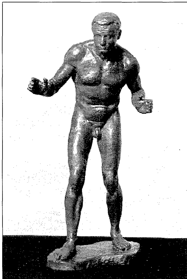
Figura 2 El Lluitador, bronze (1935?). Figura 2. El Luchador, bronze (1935?).