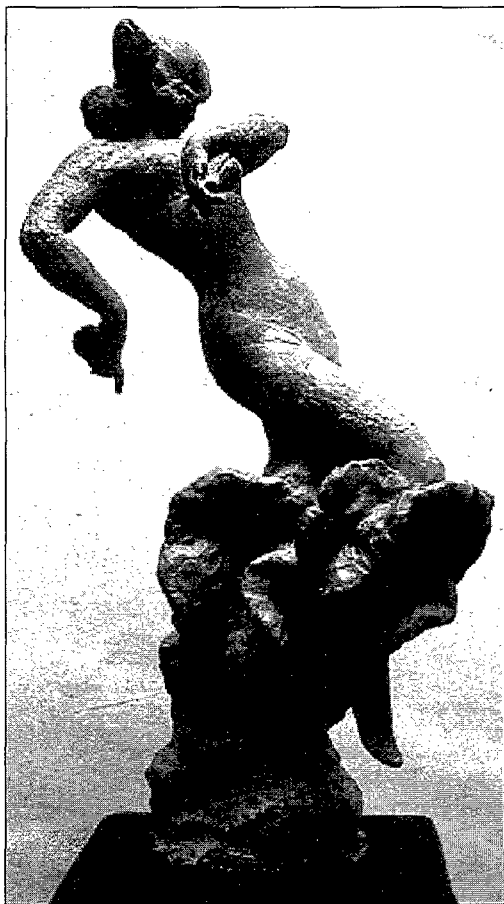
Figura 5. Sevillana, terra cuita (1972). Figura 5. Sevillana, terracota (1972).

litzà alguns dibuixos d'estudi i acabà modelan en guix la figura d'un Lluitador (63 x 30 x 36 cm). L'obra que ha adquirit el Museu de l'Esport, és la reproducció en bronze, realitzada en 1993. Existeix una ampliació en guix de tamany natural. Anecdòticament, la relació de l'escultor amb l'esportista, despertà en aquest afeccions artístiques que desenvolupà com dibuixant, autor d'obres d'apreciable valor.