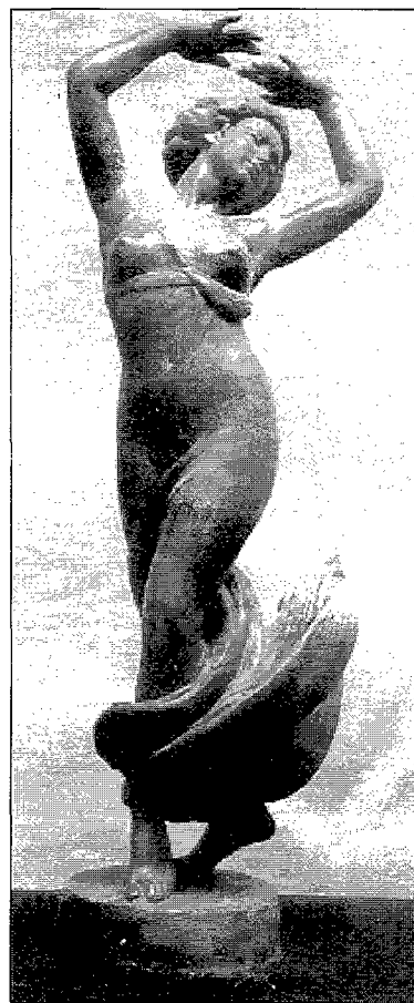
Figura 4. Salomé, guix (1954). Figura 4. Salomé, yeso (1954).

Para Montané "la danza es la expresión más clara de la plasticidad pura". Esta concepción le ha llevado a plasmar repetidamente la dinámica del movimiento de la bailarina. Se inició en este terreno con obras de evocación clásica, para centrarse posteriormente en el estudio casi exclusivo de la danza española, Rodin, Bourdelle y Clara que, a primeros de siglo admiraron y dibujaron repetidamente los bailes de la genial Isadora Duncan, no lograron modelar esculturas que reflejaran el ritmo y la armonía que expresan las danzarinas de Montané.