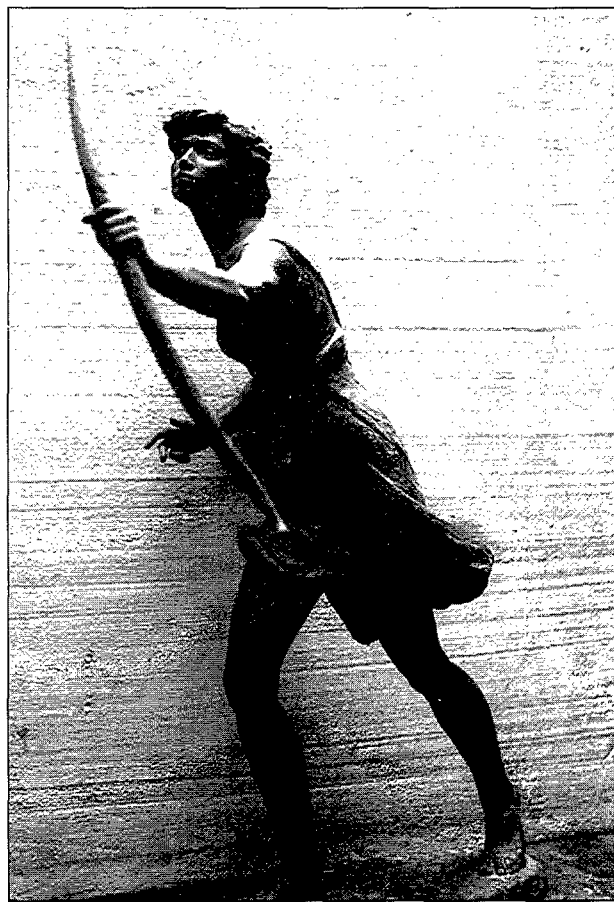
Figura 6. Diana Caçadora, guix. Figura 6. Diana Cazadora, yeso.