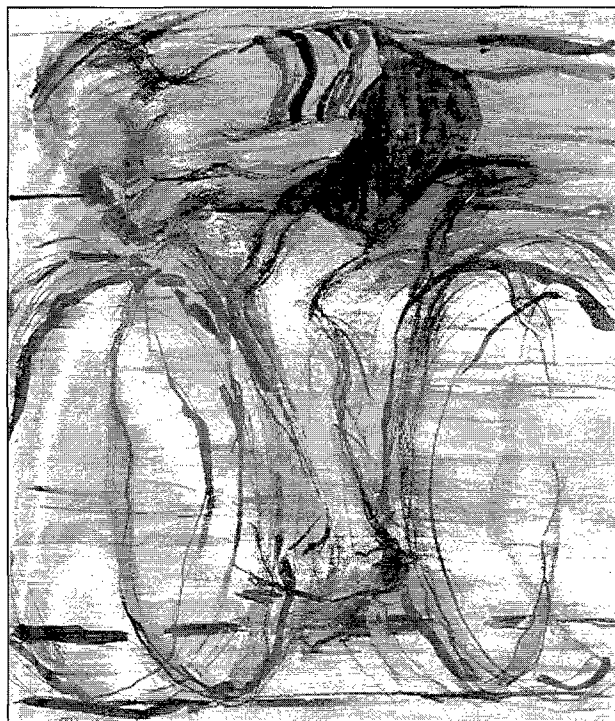
Figura 1. Figura 1.

Durant el propassat abril, el Museu de L'Esport de Barcelona ha acollit l'obra pictòrica de Marta Grífol. Aquesta és una jove pintora (Piera, 1969) de sòlida formació en Belles Arts. Llicenciada en Restauració, ha conrreat aquesta especialitat en l'acreditat Servei de Conservació i Restauració de Bens Mobles del Monestir de Sant Cugat.