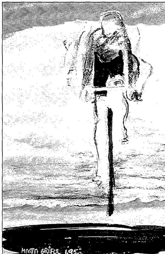
Figura 3. Figura 3.

Creiem hem conegut una sorprenent i excel·lent artista de l'esport, de la qual ens agradaria saber si intentarà dedicar obra a d'altres esports o seguirà monogràficament en el ciclisme.