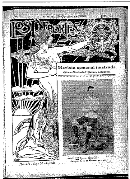
Portada de Los Deportes con la fotografía de Joan Gamper

La obra mencionada es el texto impreso de la comunicación Tres mil quinientos casos de traumatismos de fútbol que se tenía que leer en el "IV Congreso de Médicos Deportivos", celebrado con motivo de los Juegos Olímpicos de Berlín de 1936. Se trata de un estudio estadístico de los casos tratados en la Mutual Esportiva de Catalunya durante los primeros años de actuación de la entidad. La Consellería de Cultura de la Generalitat de Catalunya hizo la inscripción en el congreso de los médicos catalanes y se encargó de la edición de ésta y otras comunicaciones para el congreso de Berlín, pero sus autores no pudieron ir a leerlas, pues estalló la guerra. 3 Se trata pues, de un trabajo inédito impreso en