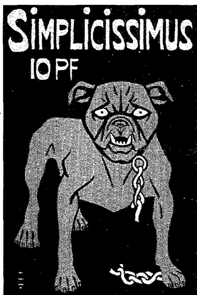
El bulldog de Simplicissimus .