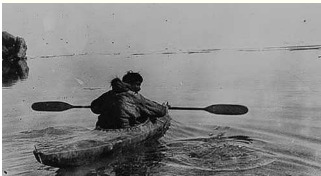
Figura 1 Caiac esquimal.