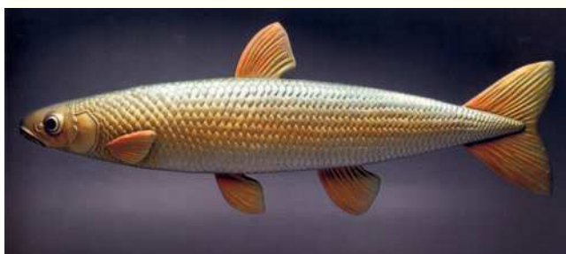
Figura 7 Leiciscus cephalus