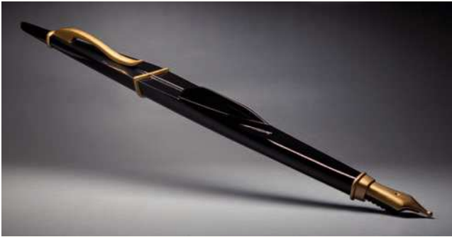
Figura 11 Grafòmana.