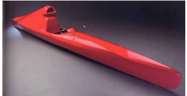
Figura 13 Metamorfosi.