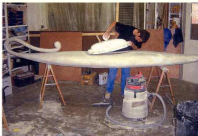
Figura 15 Construcció de la Canoa d'Aladino.

A part de l'indiscutible valor artístic de la totalitat de les obres, s'ha de ressaltar molt especialment la seva originalitat i la sens dubte dificultat en la realització.