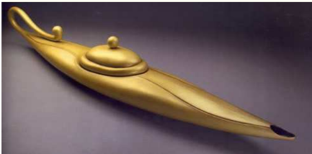
Figura 12 Canoa d'Aladino.