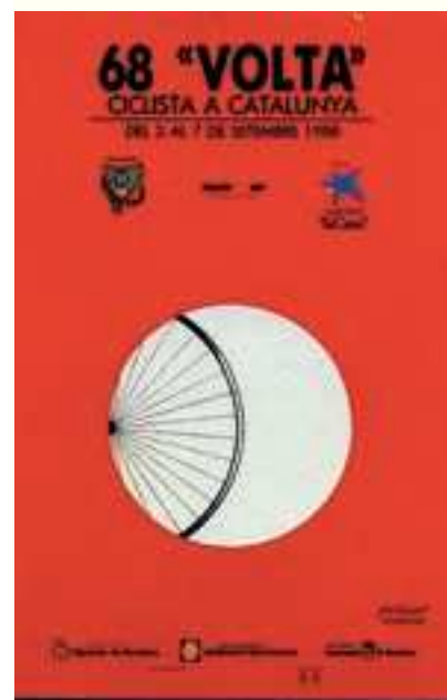
Figura 21 Cartell de la 68a Volta, 1988. Autora: M. Gudiol.