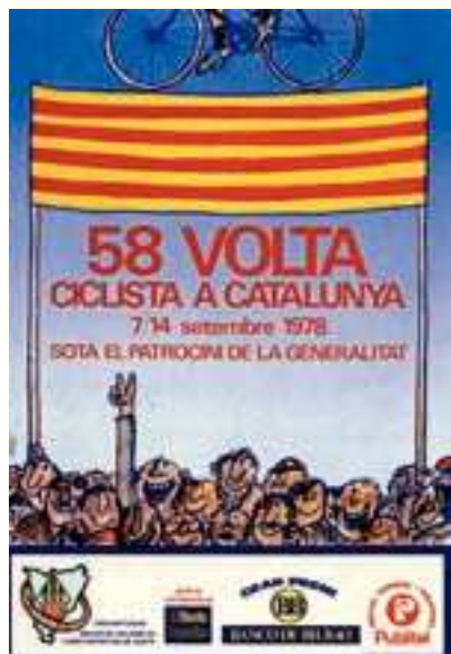
Figura 13 Cartell de la 58a Volta, 1978. Autor: Cesc.