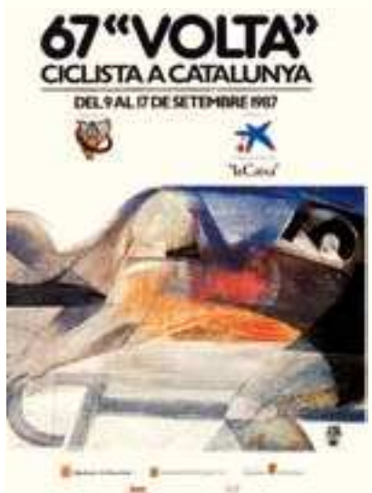
Figura 20 Cartell de la 67a Volta, 1987. Autor: J. Alumnà.