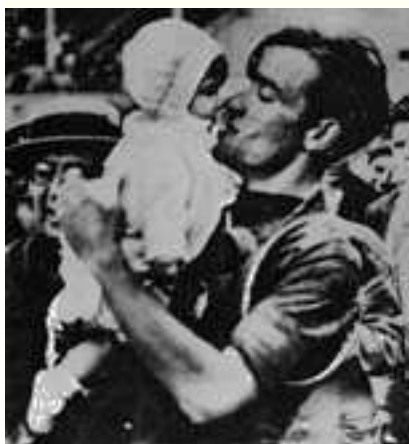
Figura 7 Mariano Cañardo.