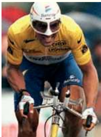
Figura 19 Miguel Indurain.