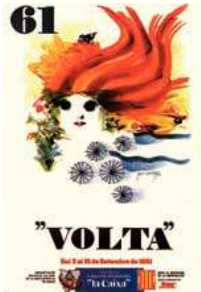
Figura 15 Cartell de la 61a Volta, 1981. Autor: M. Cuixart.