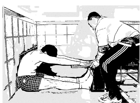
Figura 2 A i B. Back saber sit and reach (BSSR).