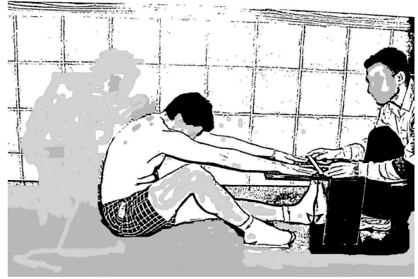
Figura 3 La planta del peu de la cama avaluada es col·loca perpendicular al terra i en contacte amb el calaix de medicació sit and reach .

L'MSR es realitzà amb el participant en sedestació, amb el cap, esquena i maluc recolzats a la paret (90° de flexió de maluc), amb cames completament esteses i la planta del peu totalment recolzada a la superfície del calaix de medicació (90° de flexió dorsal). En aquesta posició, el participant fou instat a col·locar una mà sobre l'altra, i tot mantenint el cap, l'esquena i el maluc en contacte amb la paret realitzar un moviment suau cap endavant valent-se exclusivament d'una abducció escapular (fig. 2A). Aleshores, la distància dels dits d'ambdues mans fins al calaix de medicació fou enregistrada com la distància entre la gema dels dits i el punt en el qual les plantes dels peus estan recolzades