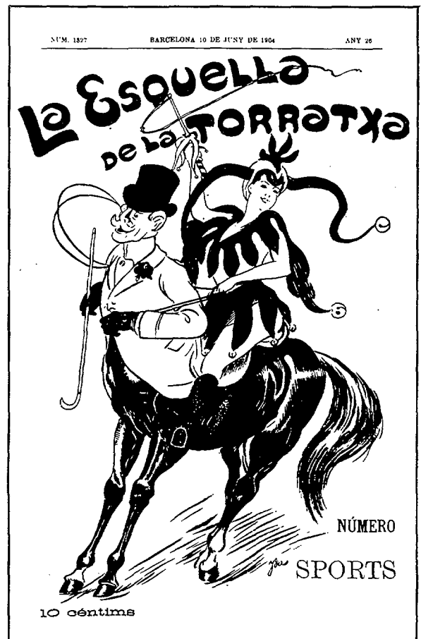
Portada del número de "L'Esquella de la Torratxa" dedicat als esports (10 de juny de 1904).

Convenç el seu pare que era millor pel negoci treballar a París i des de 1905 fa llargues estades a la ciutat dels seus somnis, on el seu dibuix es veu inequívocament influït pels dibuixos de Steinlen, Toulouse-Lautrec i el cartellista Cappiello. Des de París, fins a 1910 envia dibuixos a "L'Esquella", plens de joia i de picantor.