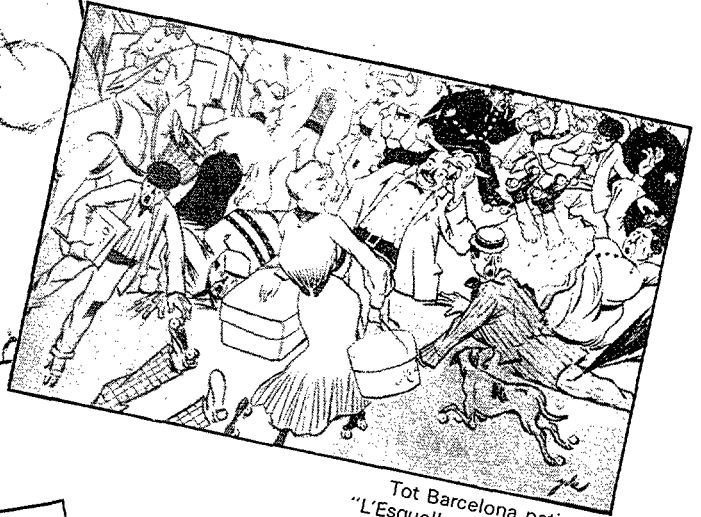
Tot Barcelona patinant! "L'Esquella de la Torratxa", 1906.