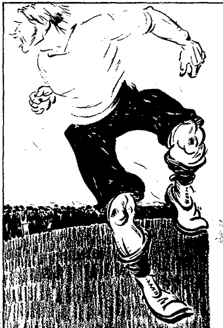
Un futbolista d'empenta.