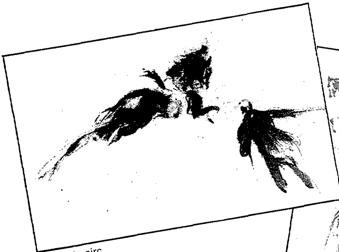
Cavall de circ.