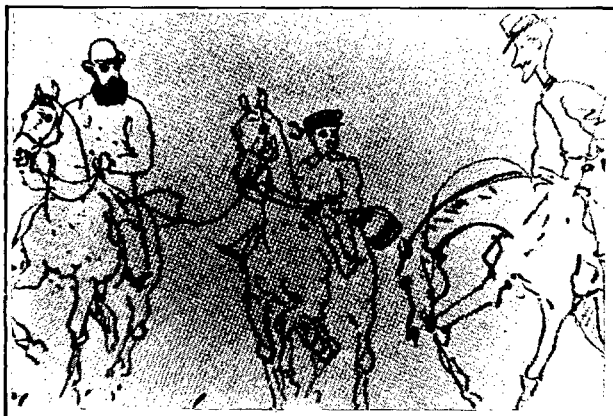
Fig. 2: Henri a cavall entre el seu pare i Princeteau. Dibuix de Renè Princeteau. 1874. Museu d'Albi.

vitamino-resistent, atribuint-li la patologia d'en Toulouse-Lautrec. És típic d'aquesta malaltia l'important curvatura dels ossos llargs, malformació que aquest no presentava i la transmissió dominant.