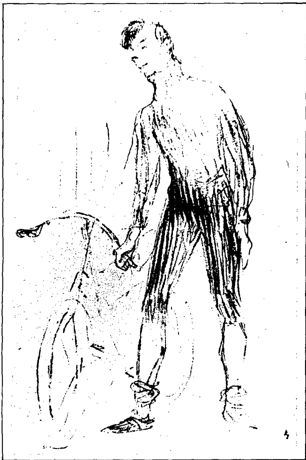
Fig. 7: "Zimmerman i la seva màquina". Litografia. 1898. Museu d'Albi.

velocipedistes. El biògraf de Toulouse-Lautrec, Paul Leclercq en descriure un gravat que representa al famós ciclista americà Zimmerman, comenta aquest costum "d'alabar públicament les avantatges de l'entrenament esportiu, amb ex-