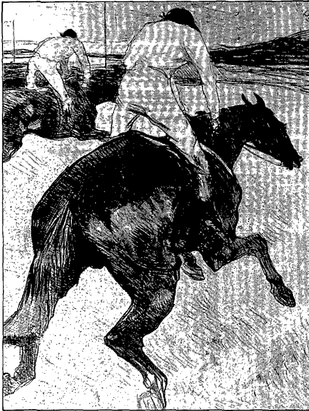
Fig. 10: "El joquei". Litografia. 1899. Museu d'Albi.