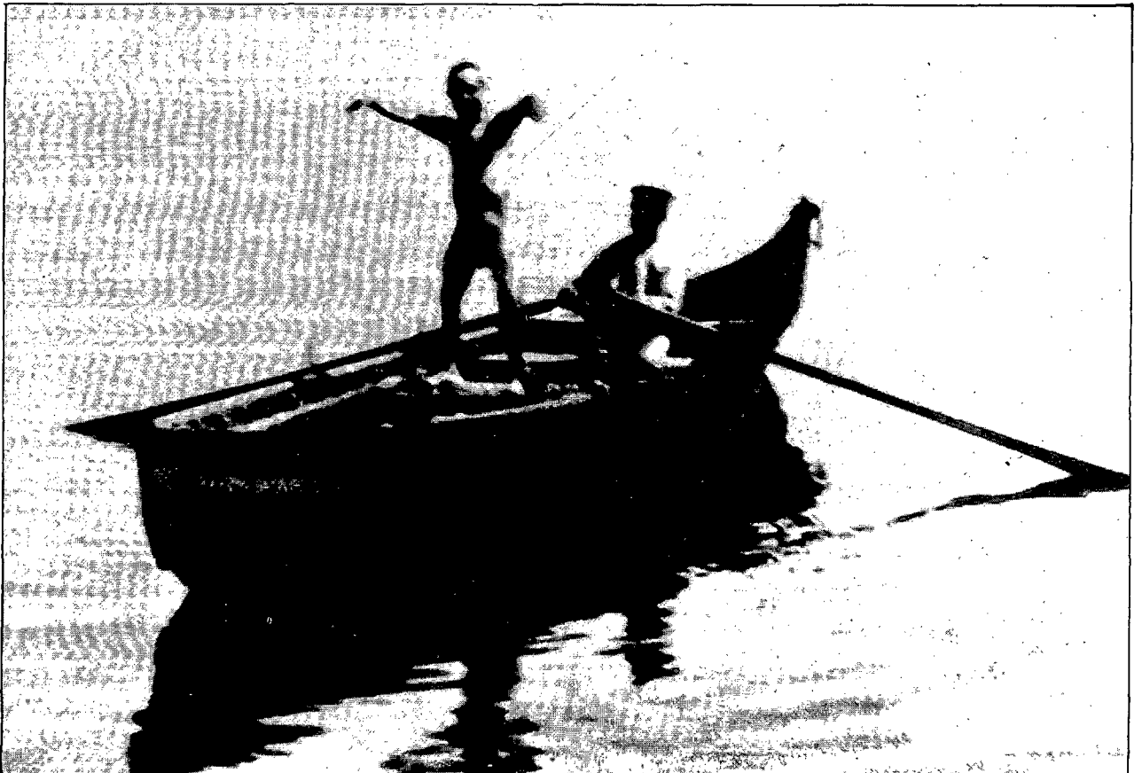
Fig. 3: Toulouse-Lautrec disposant-se a llançar-se a l'aigua (1899-1900).