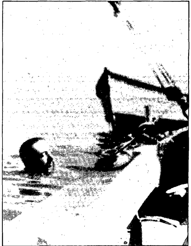
Fig. 4: Toulouse-Lautrec nedant (1899-1900).

Existeixen testimonis que demostren que Toulouse-Lautrec tenia la fontanel·la oberta. Potzer per això a la majoria de fotografies el veiem amb barret que li protegeix el crani. A moltes caricatures es pot comprovar l'anormal forma del maxil·lar inferior. La estatura baixa, les cames curtes, les mans petites, les dues fractures patològiques, el