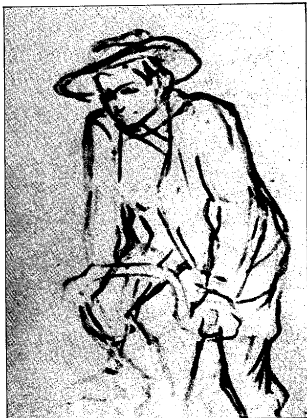
Fig. 6: "Bruant en bicicleta". Carrò. 1892. Museu d'Albi.