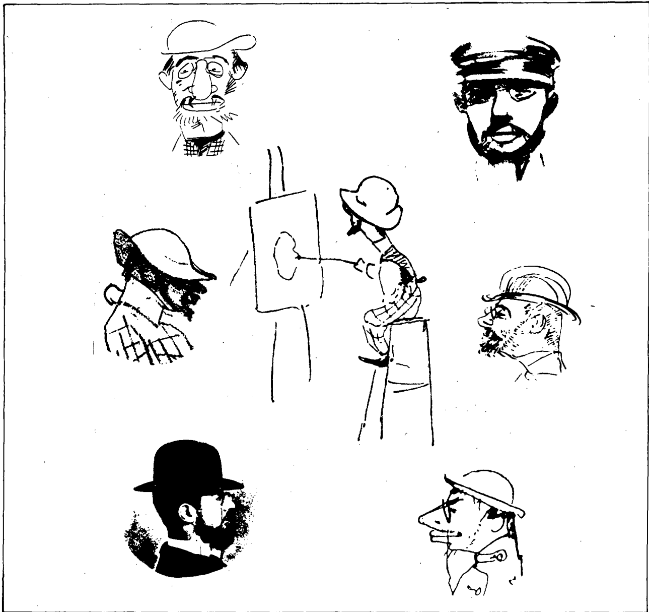
Fig. 1: Retrat i autocaricatures de Toulouse-Lautrec, on poden observar-se algunes de les malformacions facials esmentades en el text.