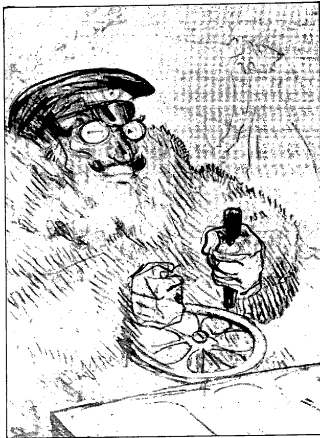
Fig. 5: "L'automobilista". Litografia. 1898. Museu d'Albi.

Els campions ciclistes el diverteixen tant com les estrelles del cafè-concert, freqüenta el barri dels corredors i realitza nombrosos retrats, litografies, dibuixos i pintures de tema ciclista. Vol persuadir a tots els seus amics de practicar la bicicleta. Alguns com Joyant i Bruant són consumats