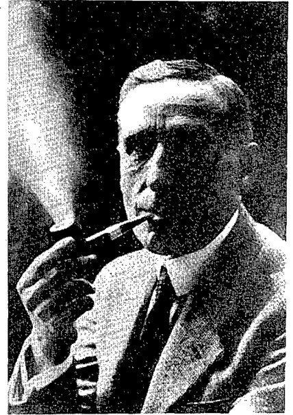
Figura 3. Pompeu Fabra fumador de pipa.

Les primeres excursions foren simples passejades pels voltants de Barcelona, semblants a les relitzades amb Massó i Torrents, l'amic que inspirà aquesta afecció. Sortida a les cinc del matí de la Plaça de Catalunya vers Sarrià, Molins de Rei, Papiol i Rubí fins a Sant Cugat, tornant pel Tibidabo i Sant Gervasi de Cassoles. Una bona caminada.