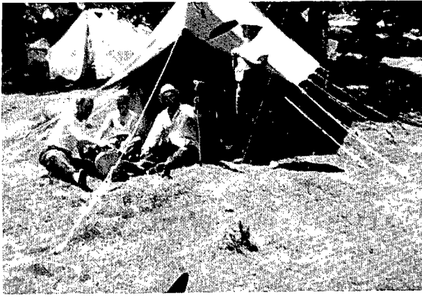
Figura 5. Fabra, a l'esquerra, al campament de Planell de Trapa l'any 1933.

que Fabra anava a l'enterrament d'un conegut, es trobà aquell senyor anglès vestit d'excursionista de cap a peus. En veure'l li digué: "Caram, on va?", i l'anglès que li contesta: "A Montserrat", i Fabra que hi torna: "M'agrada, també hi vinc". I tal con anava acompanyà l'anglès fins al Monestir.