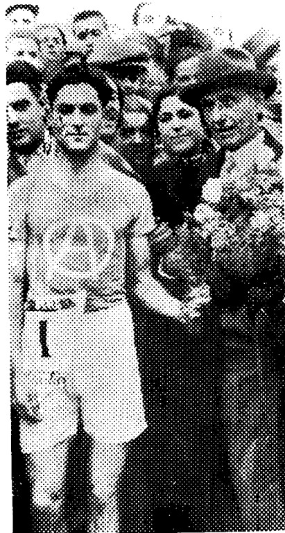
Figura 6. Mestre Fabra president de la U.C.F. lliurant un ram de flors al guanyador de la "Jean Bouin" del 1935.

Pere Gabarró, acabava una conferència dedicada al Mestre l'any 1968, anomenada "Any Fabra" per ser el centenari de la seva naixença, amb unes paraules que creiem sintetitzen magníficament el significat de la vida de Pompeu Fabra: "Mestre Fabra ens ensenyà dos dels camins més nobles per a la nostra dignitat de catalans: primer, el conèixer bé i estimar més la nostra terra i segon, el de polir i dignificar la nostra llengua".