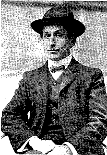
Figura 2. Fabra cap el 1916.

de la llengua catalana" (1932), passant pel "Sil·labari català" (1904), el "Tractat d'ortografia catalana" (1904) o la "Gramàtica catalana" (1918) entre d'altres està dedicada al perfeccionament i ordenació de la Llengua Catalana. Fins i tot durant els deu anys (1902-1912) d'estada a Bilbao on exercí com a Catedràtic de Química en l'Escola d'Enginyers, continua treballant en la reforma de la llengua. Fabra és el Mestre per antonomàsia que ha ensenyat a escriure a tots els catalans i al mateix temps els ha donat la satisfacció de l'idioma propi.