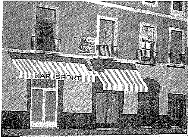
Figura 3. Besalú.

mo que hablar de la llegada del fútbol. Y el fútbol llegó de Inglaterra y con él llegó el "sport", el "referee" ("refli"-árbitro), el "out" ("aut"-fuera), el "corner" ("corner"-saque de esquina), el "goal" ("gol"), el "free kick" ("frequid"-golpe franco) o el "kick off" ("quicoff"-saque de honor), palabras bien enraizadas en el argot futbolístico de nuestros padres y en semanarios de humor como el XUT!, que tanta influencia tuvieron en nuestro lenguaje futbolístico.