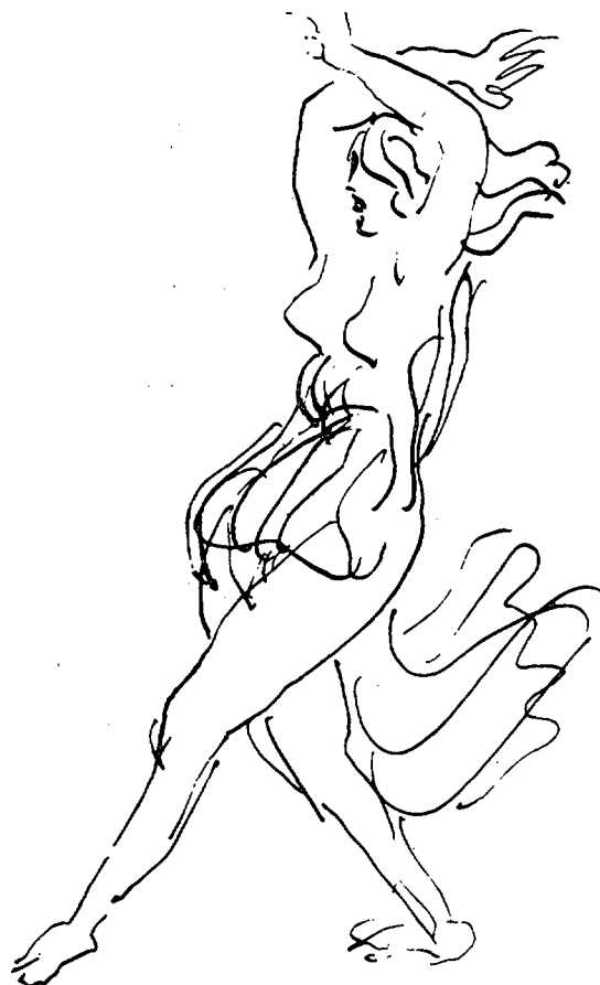
Figura 5. Isadora Duncan per Emile-Antoine Bourdelle. Figura 5. Isadora Duncan por Emile-Antoine Bourdelle.

De todas las esculturas de Emile-Antoine Bourdelle (Moutauban, 1861-Le Vésonet, 1929), Heracles Arquero es la más célebre y la que le proporcionó el año 1910 su primer triunfo. Bourdelle modeló esta obra en 1909, en grandes dimensiones, realizando después numerosas versiones y estudios de diferentes tamaños. El ejemplar en bronce del Museo Olímpico, fue fundido en 1921 y su altura con zócalo es de 71,5 cm. Para los estudios del Heracles Arquero , posó un comandante de coraceros que era un extraordinario atleta, llamado Doyen Parigot, militar que murió en la batalla de Verdún. Durante la