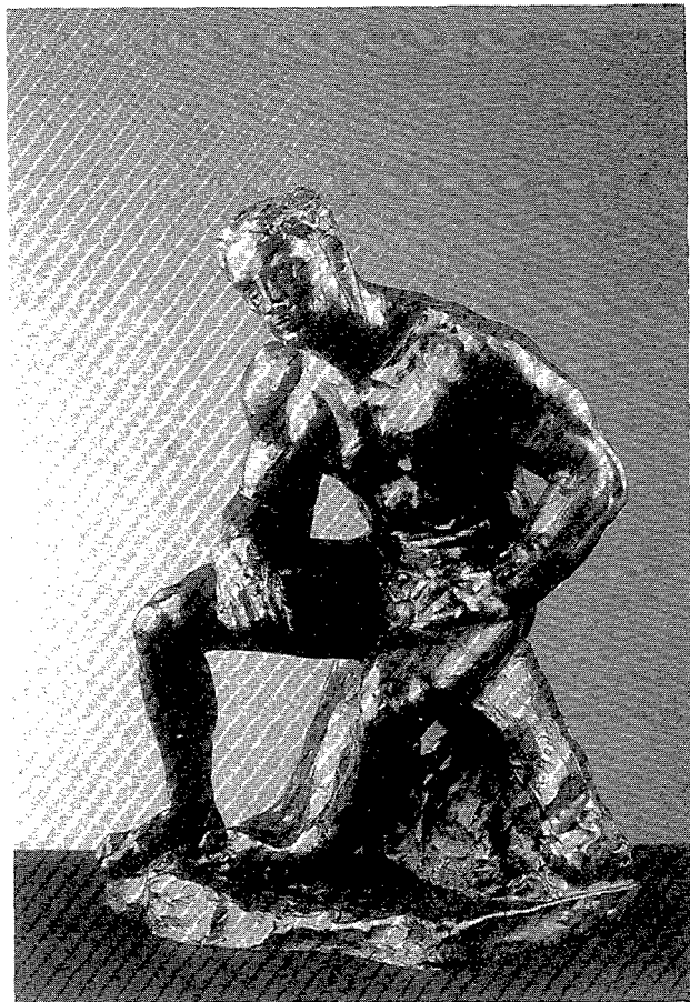
Figura 2. "L'Atleta", August Rodin. Figura 2. "El Atleta", August Rodin.

Des de que l'any 1982 s'inaugurà el Museu provisional, el CIO ha realitzat una intel·ligent i selectiva política d'adquisició d'obres d'art que, junt amb les moltes que li han estat ofertes per diferents institucions d'arreu, li han proporcionat un extraordinari patrimoni artístic. Entre aquest conjunt d'art podem tindrà caràcter emblemàtic del Museu dues escultures: l'Atleta de Rodin i l'Hèracles