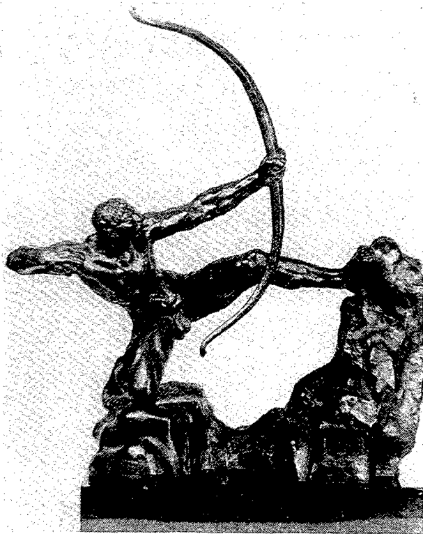
Figura 3. "Hèracles Arquero", Emile-Antoine Bourdelle. Figura 3. "Heracles Arquero", Emile-Antoine Bourdelle.

estètica, pròpia de la reconeguda valia artística de sus autores, poseen un curiós anecdotari en relació con los personajes que sirvieron de modelo.