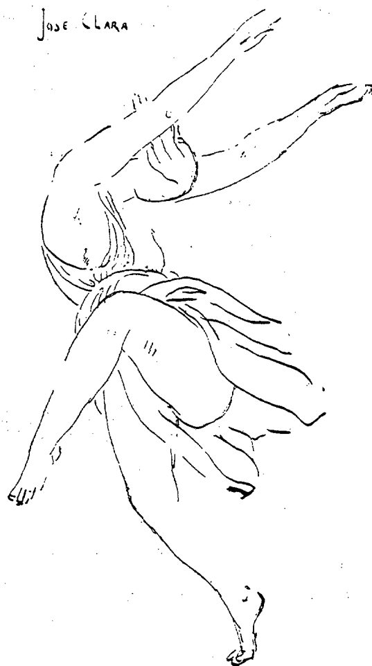
Figura 6. Isadora Duncan per Josep Clarà. Figura 6. Isadora Duncan per Josep Clarà.

Sens dubte, si Rodin, Bourdelle i Clarà haguessin pogut observar el moviment i el ritme, alguns