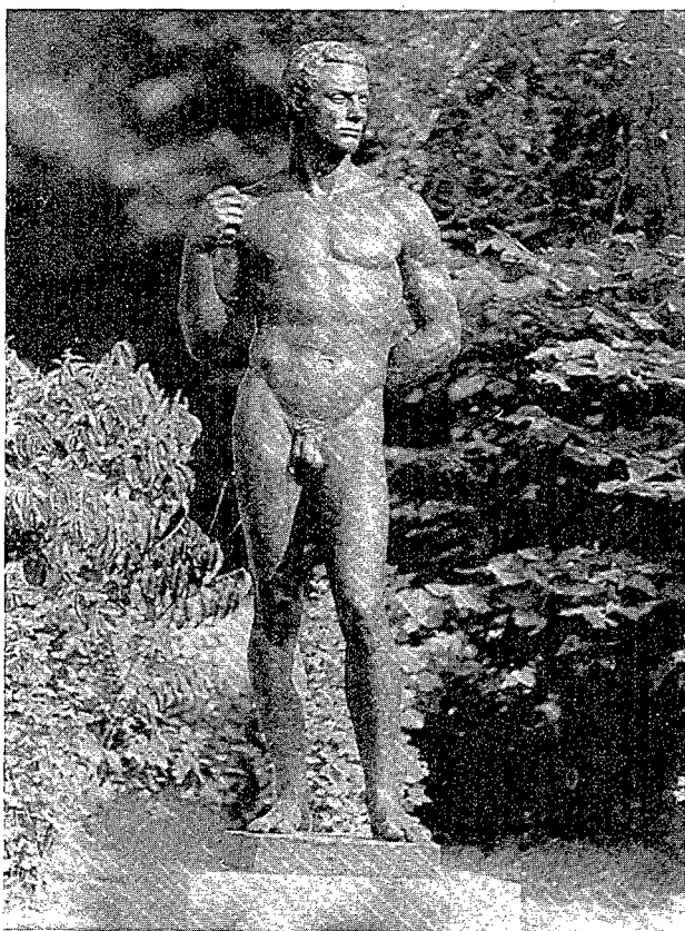
Figura 4. "L'Atleta", Josep Clarà. Figura 4. "L'Atleta", Josep Clarà.

Arquer de Bourdelle. Són dues obres que, deixant a part la seva qualitat estètica, pròpia de la reconeguda vàlua artística dels seus autors, posseeixen un curiós anecdotari en relació amb els personatges que serviren de model.