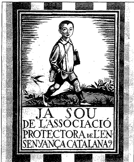
Figura 1: Cartell de l'APEC. Figura 1: Cartel de la APEC.

Se ha dicho que Obiols ha sido la imagen gráfica del noucentismo y es característico del noucentismo catalán la proliferación de ex-libris, pequeñas obras de arte que identifican la propiedad de un libro. El ex-libris es el resultado de un buen entendimiento entre el creador y el destinatario y por esto no todos los artistas los han realizado. Josep