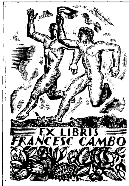
Figura 2: Ex-libris de Francesc Cambó; xilografia: 26,5 x 22 cm.