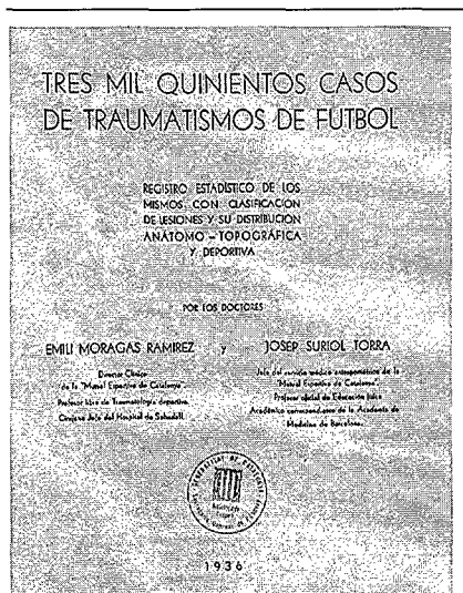
Estudi dels doctors Moragas i Suriol realitzat per a la Mutual Esportiva de Catalunya

■ Gràfic-sport (1926-1927). El primer número es publicà el novembre de 1926, incorporava els millors redactors i reporters gràfics del moment.