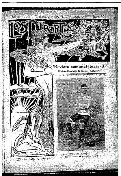
Portada de Los Deportes amb la fotografia de Joan Gamper

L'obra esmentada és el text imprès de la comunicació Tres mil quinientos casos de traumatismos de fútbol que s'havia de llegir al "IV Congrés de Metges Esportius", celebrat en motiu dels Jocs Olímpics de Berlín el 1936. Es tracta d'un estudi estadístic dels casos tractats a la Mutual Esportiva de Catalunya durant els primers anys d'actuació de l'entitat. La Conselleria de Cultura de la Generalitat de Catalunya féu la inscripció al congrés dels metges catalans i es va fer càrrec de l'edició d'aquesta i d'altres comunicacions per al congrés de Berlín, però els seus autors no van poder anar a llegir-les, perquè va esclatar