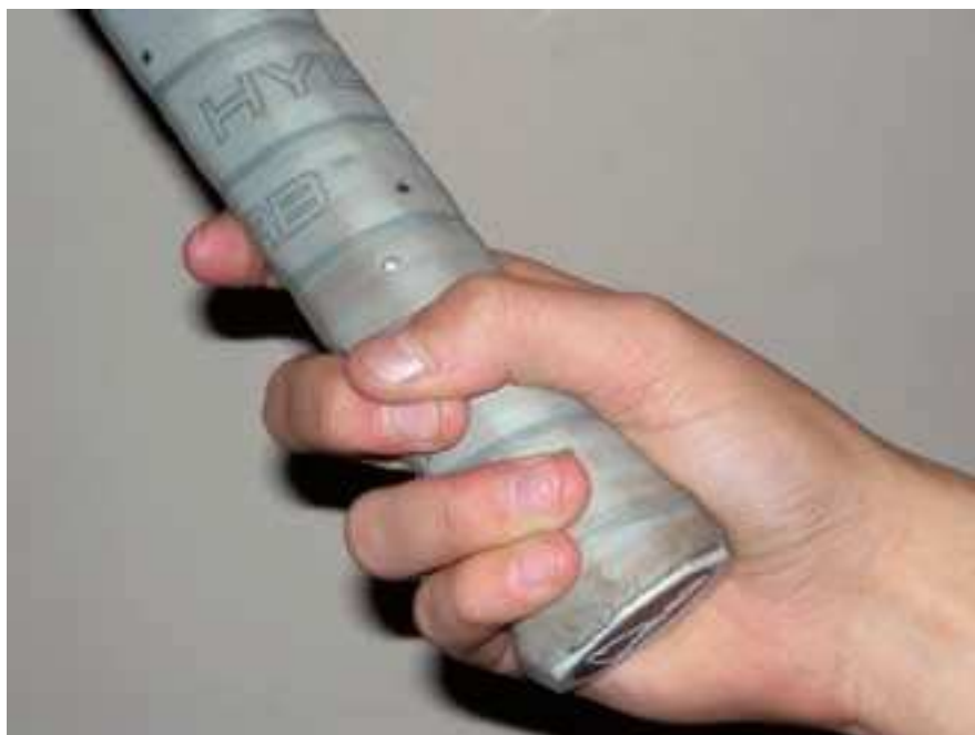
Figura 1 Imagen de agarre (grip) de la raqueta de tenis.

vidad deportiva habitual bajo estricta supervisión, especialmente en lo que a dolor o molestias se refiere.