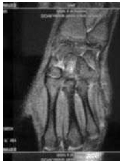
Figura 2 La imagen de RM pone de manifiesto la fractura trabecular en hueso grande.

su delicado aporte circulatorio y la posibilidad de que se produzca una necrosis avascular de manera parecida a lo que sucede con el escafoides. En el hueso grande los vasos sanguíneos fluyen longitudinalmente de distal a proximal, y es precisamente este flujo retrógrado lo que provoca en el hueso grande el riesgo de necrosis avascular. De igual manera, la pobre revascularización después de una fractura es lo que puede conllevar también un retraso en la consolidación 12,13 . Este problema no lo tuvo nuestra tenista debido a que el fragmento –palmar– no era lo suficientemente grande para que un retraso de consolidación pudiera traducir clínica.