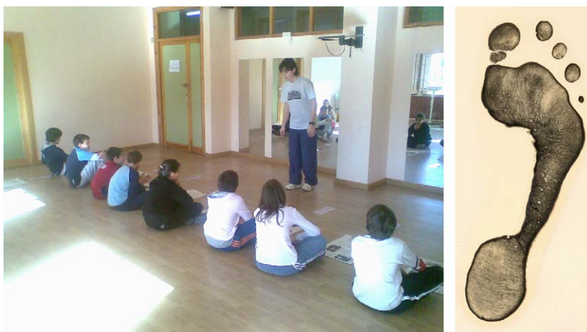
Figura 1 Obtención de la huella plantar mediante fotopodograma y ejemplo de una huella de un sujeto del estudio.

FFM: fat free mass ‘peso libre de grasa’; IMC: índice de masa corporal; n=número de sujetos.