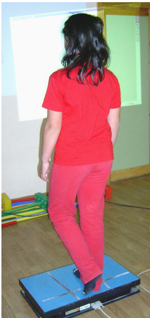
Figura 2 Test de apoyo monopodal.

Test de apoyo monopodal (fig. 2): el niño subía a la plataforma descalzo, colocando el pie derecho sobre las líneas de referencia en los planos frontal y sagital marcadas previamente sobre la plataforma. El niño debía mantener la pierna libre sin rozar la de apoyo ni la plataforma para permanecer lo más quieto posible durante los 10s que duraba el test. El niño debía mantener durante todo el test los brazos a lo largo del cuerpo, los ojos abiertos y la mirada fija en una cruz (con el eje horizontal más largo que el vertical) situada enfrente a 1,5m de la plataforma y permanecer lo más inmóvil posible durante la medición.